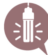
Lampe basse consommation