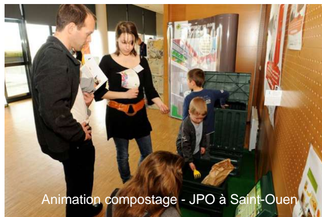
Animation compostage - JPO à Saint-Ouen