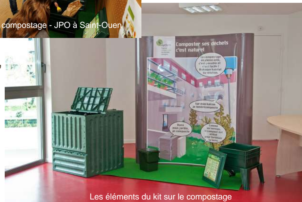
Les éléments du kit sur le compostage

➔ 55 kits (55 stands + 20 000 flyers) distribués gracieusement aux collectivités (6 CA , 24 collectivités et les 2 syndicats primaires)