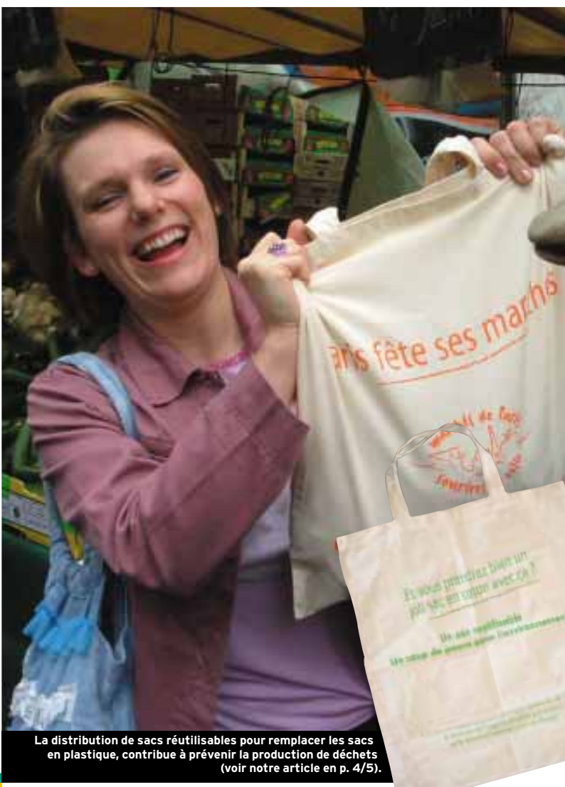
La distribution de sacs réutilisables pour remplacer les sacs en plastique, contribue à prévenir la production de déchets (voir notre article en p. 4/5).