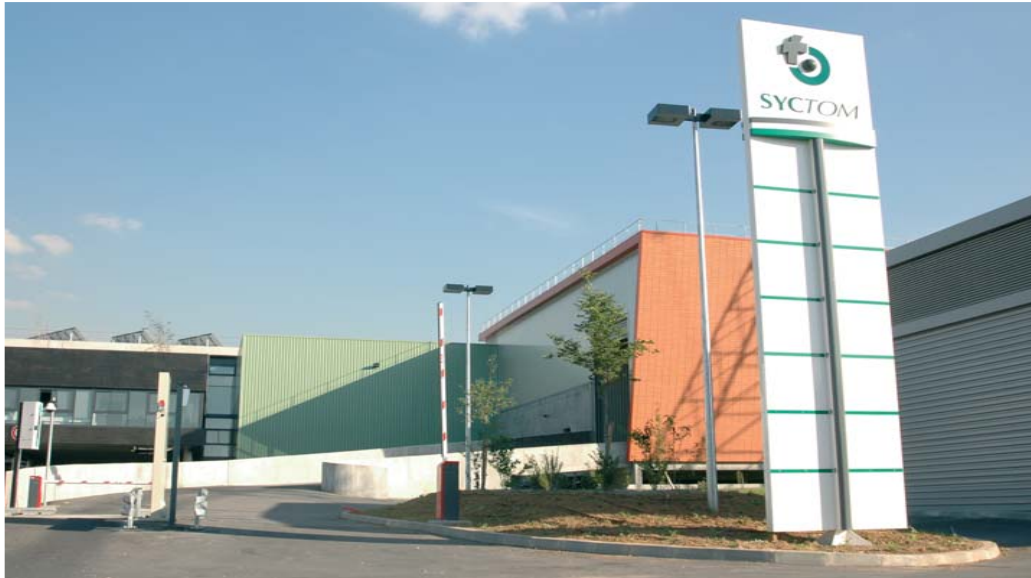
Le centre de tri des collectes sélectives à Nanterre a démarré son activité en juin 2004.

Pour orienter davantage de déchets triés vers les filières de traitement les mieux adaptées à leur valorisation, le SYCTOM soutient un projet visant à renforcer le réseau de déchetteries de proximité : il a adopté en 2004 le principe d'un appui technique et d'une subvention spécifique aux communes qui créent ou améliorent leurs installations. En outre, soucieux de diversifier les modes de traitement, il s'est engagé en 2004 dans un projet de méthanisation des déchets en