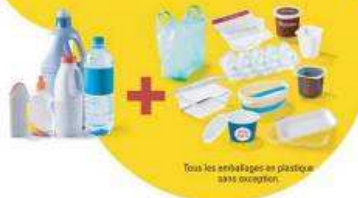
Tous les emballages en plastique sans exception.

Vous continuez à déposer dans votre bac de tri tous les emballages métalliques, les emballages en carton, les papiers et, en plus de cela, tous vos emballages en plastique sans exception.