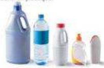
Bouteilles et flacons en plastique.

Vous déposiez dans votre bac de tri tous les emballages métalliques, les emballages en carton, les bouteilles et flacons en plastique.