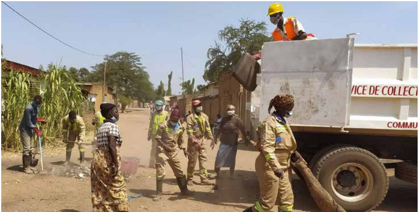
Projet de service de gestion des déchets au Tchad

Depuis 2015, le Syctom soutient financièrement des projets internationaux qui visent l'amélioration de la gestion des déchets. L'objectif : accélérer la transition écologique, en lien avec la réalisation des Objectifs de développement durable (ODD) définis par les Nations Unies. Avec l'appel à projets Solidarité Déchets 2021, il réaffirme son engagement et apporte sa contribution à neuf nouveaux projets.