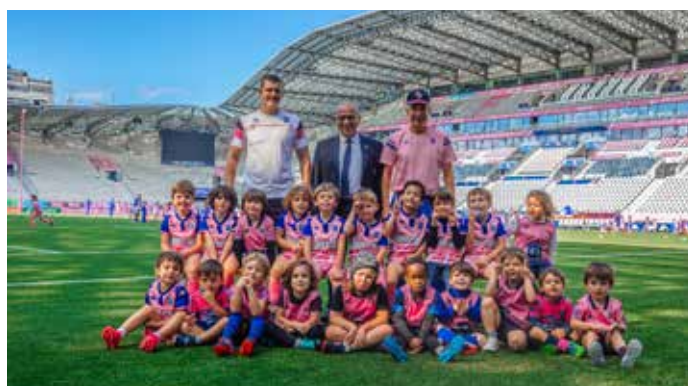
De nouvelles actions de sensibilisation vont être menées pour toucher le jeune public.

ce processus éducatif ainsi que dans sa recherche d'innovation. Et enfin gagnant pour le Stade Français Paris, grâce à un outil supplémentaire pour sa politique RSE. Tout comme le Syctom, nous sommes convaincus que l'avenir de la planète passera par l'éducation et la communication. » Une expérience amenée à durer, le partenariat prévoyant un renouvellement pour plusieurs années.