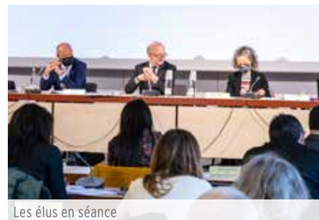
Les élus en séance

jouer pleinement son rôle aux côtés des territoires dans une vision globale de la gestion des déchets. Cette volonté est complémentaire et totalement cohérente avec la mise en place du Schéma de coordination "prévention, collecte, traitement" confié par l'Etat et la Région Île-de-France dans le cadre du PRPGD » explique Éric Cesari, Président du Syctom. Avec cette nouvelle impulsion, les territoires seront aussi mieux armés pour se conformer au cadre législatif qui prévoit d'ici à 2025 de réduire de 50 % les déchets enfouis et de recycler 65 % des emballages, tous types confondus.