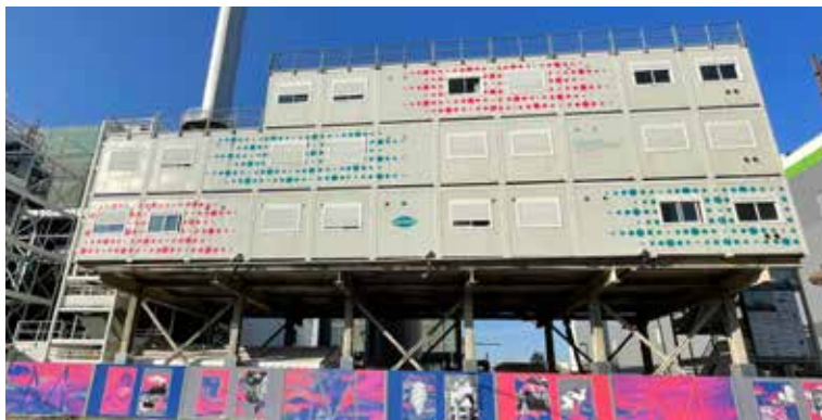
Série d'affiches réalisée par le collectif Super Terrain

Missionné depuis 2012 par le Syctom pour accompagner la transformation du centre à Ivry/Paris XIII , Stefan Shankland cherche à traduire artistiquement les grandes mutations en cours : au quotidien une mutation de la matière usée et sa transformation en énergie, à moyen terme une mutation architecturale avec la refonte du centre et à long terme une mutation urbaine avec la transformation du territoire. Le MMM (Musée du Monde en Mutation) invite les artistes à rendre manifestes ces transformations silencieuses. Installée sur les palissades du chantier, une exposition de 10 affiches réalisées par le collectif Super Terrain offre aux passants une vision de la métamorphose du site et de ce chantier hors norme.